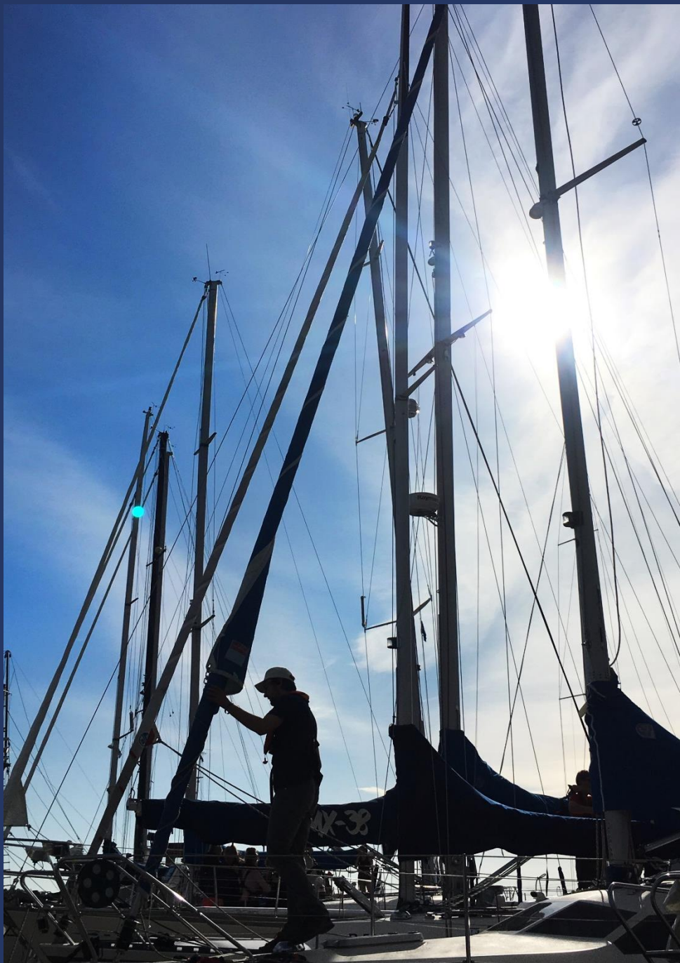
Kuva: Eeva Helle